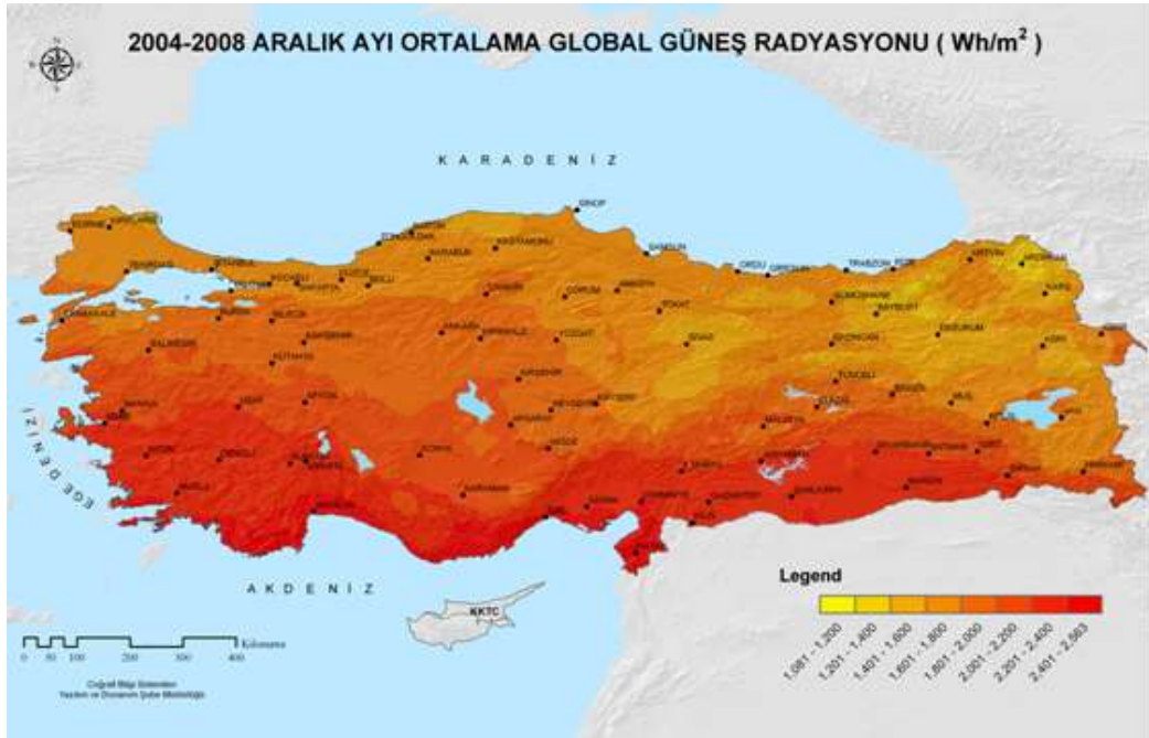
Şekil 4. 2004-2008 yılları arası Aralık ayları ortalama global güneş radyasyonu dağılım haritası