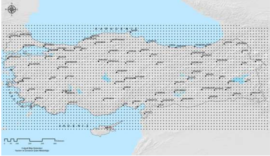
Şekil 1. Model çıktılarına göre hesaplanan Türkiye'deki 3610 grid noktasının Merkezleri

grid noktasının merkezleri gösterilmiştir. Grid noktalarının her biri 0,2° enlem ve 0,2° boylama eşit bir alanı temsil etmektedir.