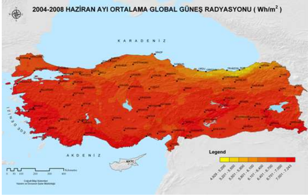
Şekil 3. 2004-2008 yılları arası Haziran ayları ortalama global güneş radyasyonu dağılım haritası.